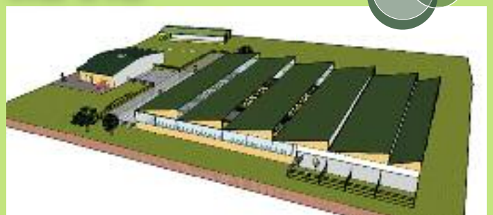
Vue en 3D du projet, avec le bâtiment abritant les 250 vaches laitières, le bloc traite et l'Hotelavo.

Cette étable sera une vitrine pour nos produits et notre savoir-faire technique. Nous y testerons grandeur nature nos nouveaux produits. L'ensemble nous permettra aussi de collecter des données, d'acquiescer des références en termes de gestion et de management d'un grand troupeau.