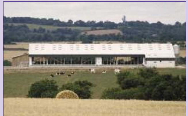
Vue générale du nouveau bâtiment