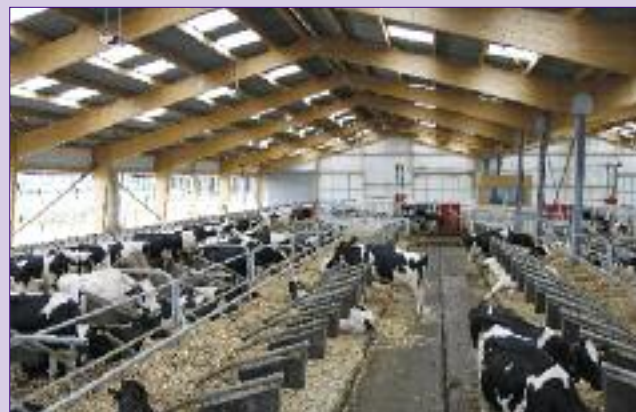
L'utilisation du bâtiment par les vaches est excellente. Elles sont uniformément réparties dans l'ensemble du bâtiment (à la traite au robot, dans les Logistalle, à la table d'alimentation, etc.). C'est la preuve de leur bien-être dans le bâtiment.