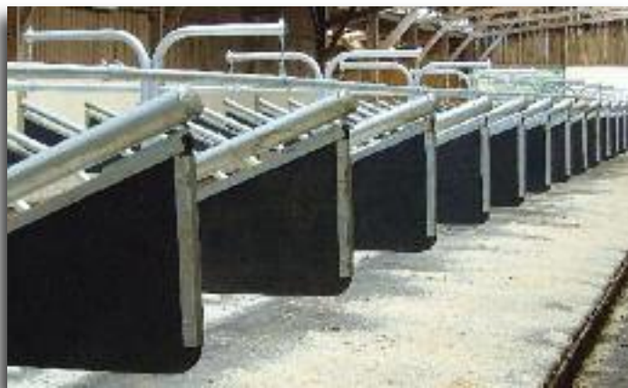
La sciure a un bon pouvoir asséchant

La sciure de qualité n'est pas facile à trouver suivant les régions. Pour permettre une bonne utilisation des matelas dans les systèmes lisiers, nous vous proposons de la sciure sélectionnée spécialement pour cette utilisation.