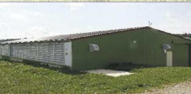
La nurserie s'intègre parfaitement dans l'environnement

Autre point de satisfaction pour les associés du Gaec, le service apporté par l'Eurl Ph. Deru. En dehors de l'aspect gros œuvre, ils n'ont eu à faire qu'à deux interlocuteurs pour l'ensemble