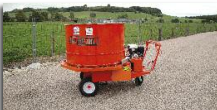
Le Hache-litière se manie aisément dans les allées d'une étable.

Elle est dotée d'une cuve de grande capacité (1,2 m de diamètre) et d'un rotor spécialement étudié, avec une disposition en spirale des couteaux, assure un débit constant et augmente la productivité avec moins d'énergie nécessaire.