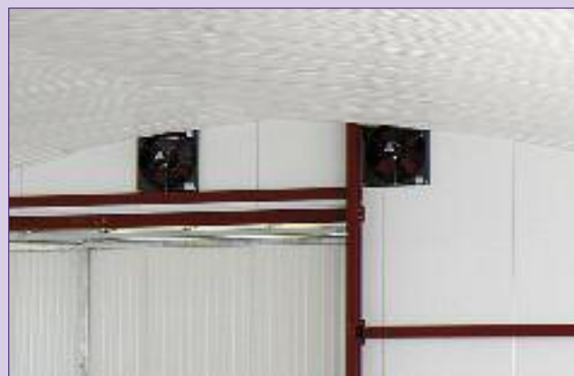
L'isolation du plafond de la nurserie est obtenue avec des panneaux isolants et un vide d'air. La seconde partie du bâtiment, qui accueille les veaux sevrés, est simplement isolé, car à ce stade ils sont moins fragiles.