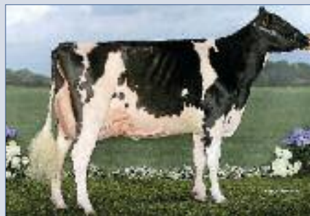
GHP Brainville - (p. Duplex) - Propriété Duf'Holstein 1 ère 305 j. 8.206 kg 3,93 % TB 3,37 % TA 2 e lact en cours. Pic à 47 kg.