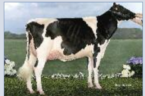
Duf'Chouette (p. Bolton) Copropriété Duf'Holstein et Eurl Ph. Deru 1 ère ec 88 j. 3.298 kg 3,63 % TB 3,02 % TA