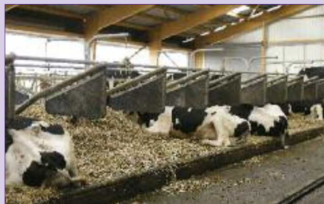
Les Logistalle reçoivent 3,5 kg de paille par vache et par jour en hiver et 1,5 kg environ en été. Le racleur passe tous les 4 heures dans les allées. « Il y a moins de mammites alors que nous avons 2 fois plus de vaches » constate Adrien Largement. Aucune vache ne s'est coincée dans les logettes depuis l'entrée en service des Logistalle.