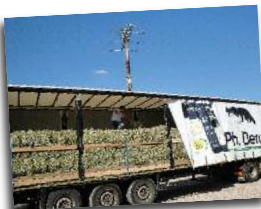
Les éleveurs exposants étaient invités à venir chercher à notre camion les bottes de foin suisse mises à leur disposition.

Mais nous n'avons pas oublié le bien-être des éleveurs pour autant. Le jeudi soir, en partenariat avec la société Néolait, l'Eurl Ph. Deru offrait un buffet !