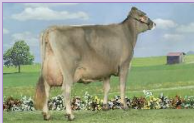
Reine - (Denmark x Pino) - 2 e 305 j. - 9.530 kg - 4,58 % TB et 4,00 %TA

Championne à Paris en 2005, 2006 et 2007 - Championne Eurogénétique 2005, 2006 et 2007 - Grande championne du National