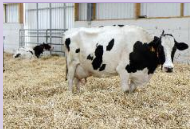
Un box paillé a été gardé, les vaches y viennent le mois précédent le vêlage. « Ce n'est pas de la place perdue », souligne Adrien Largement. « Les vaches qui ont un vêlage difficile y restent 1 ou 2 semaines avec une alimentation différente et une surveillance plus attentive. »