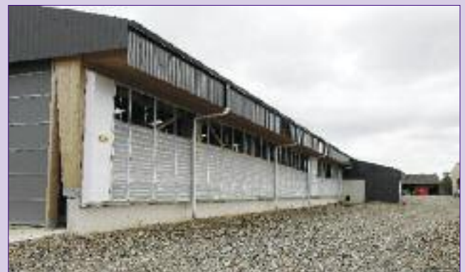
C'est l'amélioration la plus importante selon Thierry Clochet, celle qui a permis d'obtenir une excellente ambiance sous le bâtiment. Les deux murs sont pilotés par une station météo en fonction de la température, de la vitesse et de l'orientation des vents.